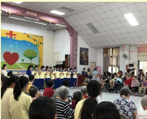
分組表演，老幼同歡樂