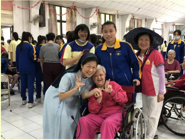
安養院長輩看到學生很開心