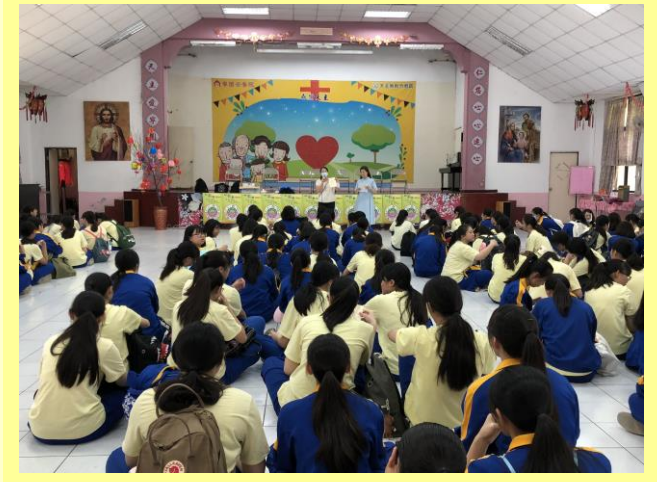
張組長簡介中心、認識阿茲海默症