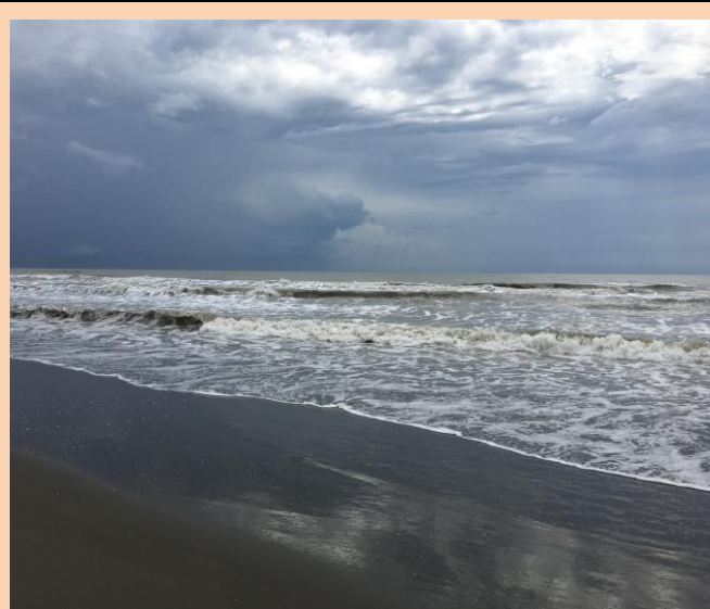
讚嘆美麗的台灣海峽