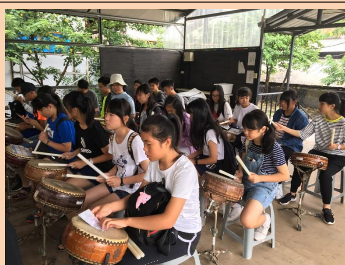
十鼓文化園區打鼓