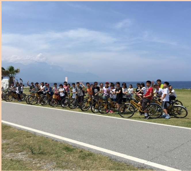
七星潭單車、協力車運動