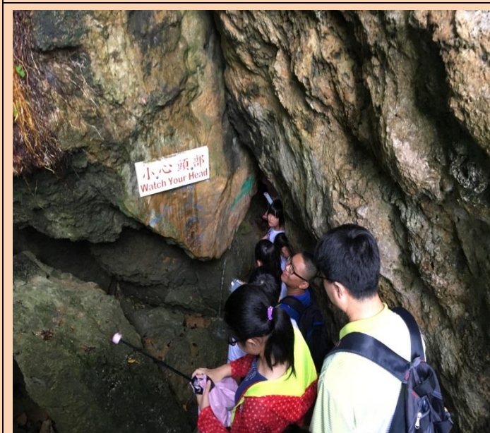
小琉球烏鬼洞探索