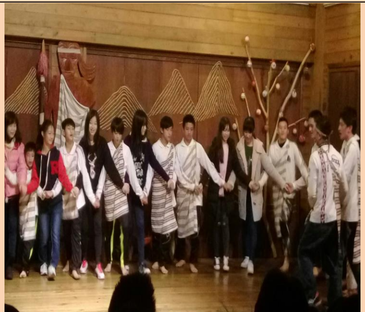
布洛灣多元文化體驗