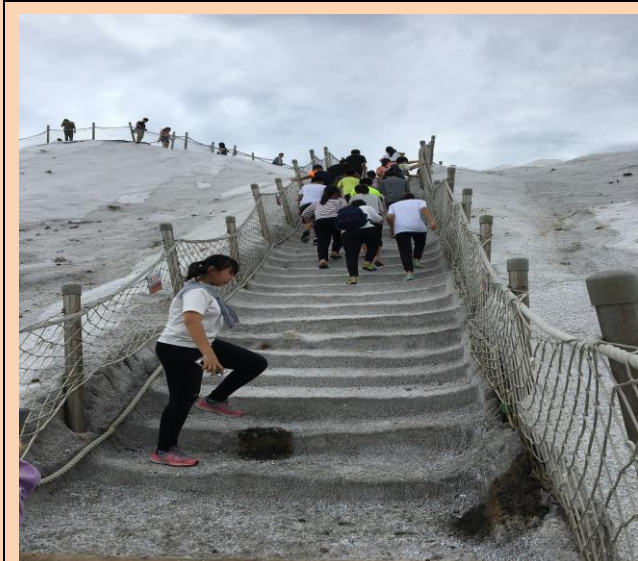
攀越全台唯一鹽山