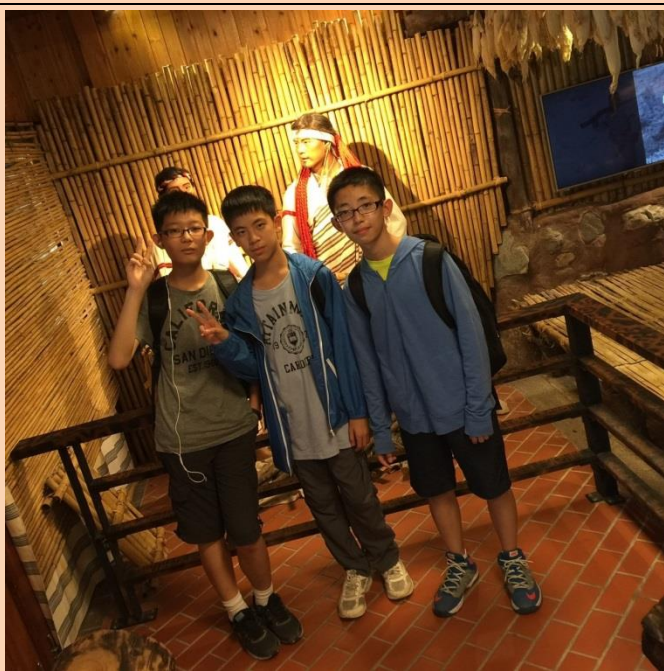
布洛灣多元文化體驗