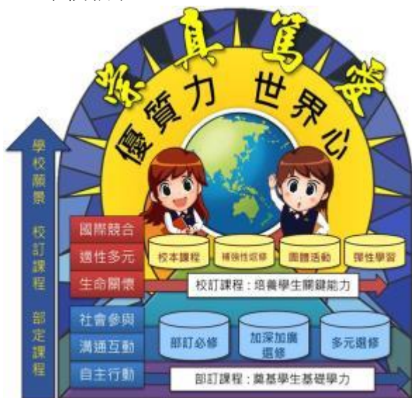
圖、曙光女中優質化前導學校108課綱理念與願景