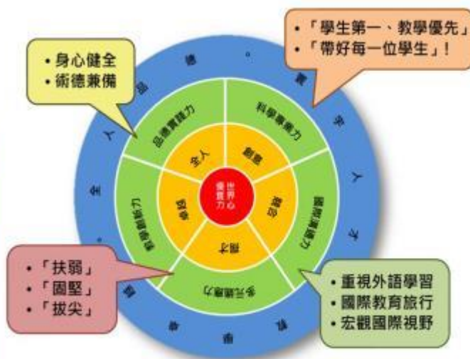
圖、曙光女中優質化教育理念