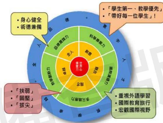
圖、曙光女中優質化教育理念