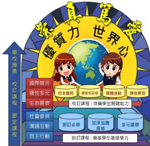
圖、曙光女中優質化前導學校108課綱理念與願景

台灣蘊藏豐富的自然與人文樣貌，地理位置是亞太重要的一環，隨著互聯網時代來臨，更躍居頂尖創意人才的搖籃。本校為德國修女所創立，本就重視語言學習，積極與國際接軌，隨著「世界是平行的」到來，更積極投入各項交流業務，期盼學生能立足台灣，以恢弘的胸懷欣賞同理各式文化特色，以追求卓越的志向投入世界創新，成為台灣之光。