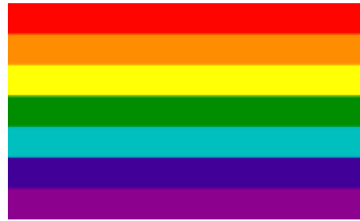
七條紋旗幟 (1978年－ 1979年)