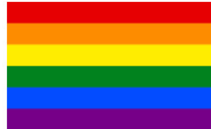
六條紋旗幟 (1979至 今) 旗幟比 例：2:3