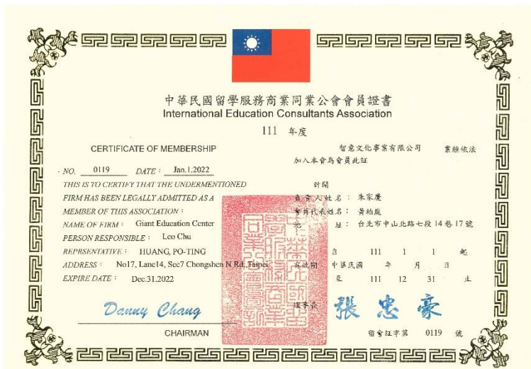
中華民國留學公會 會員證書