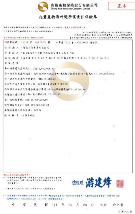
遊學履約責任險壹千萬